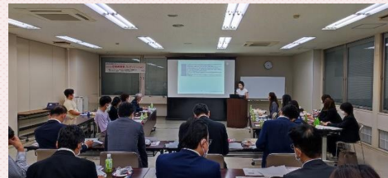
創業塾事業発表(ファイナリストプレゼンテーション)の様子(9月21日)