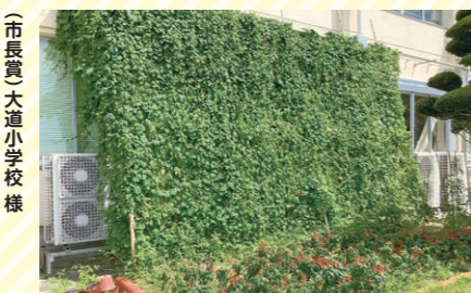
市長賞 大道小学校様