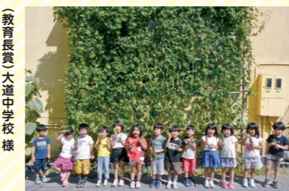
特別表彰 きんご第2保育園様