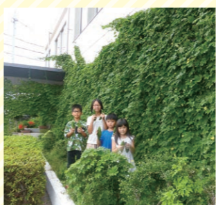
牟礼福祉センター様