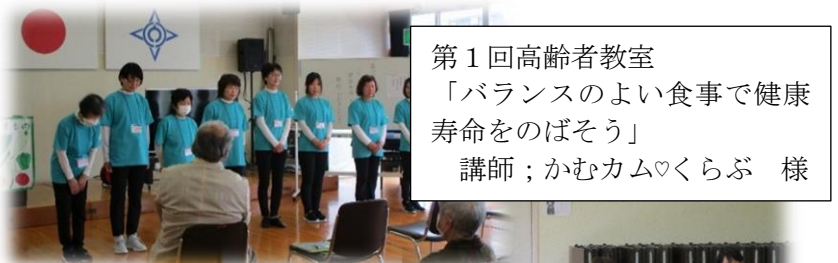
第1回高齢者教室 「バランスのよい食事で健康 寿命をのばそう」 講師；かむカム♡くらぶ 様